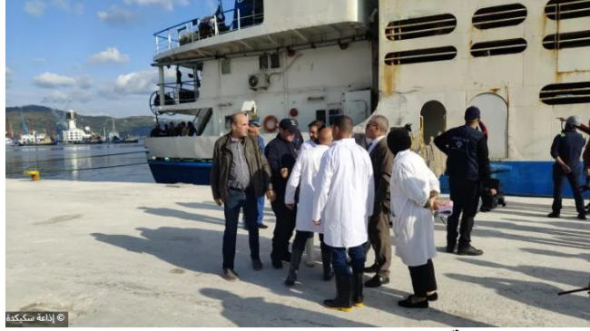
جانب من عملية رسو باخرة الشحن "KARAZI" بميناء سكيكدة

وصلت اليوم الأحد إلى ميناء سكيكدة باخرة الشحن "KARAZI" محملة بـ 14600 رأس من الغنم المستورد من رومانيا، في إطار الجهود المبذولة لضمان وفرة الأضاحي تحسباً لعيد الأضحى المبارك. ويأتي هذا الوصول بعد يوم واحد فقط من رسو باخرة أخرى بميناء وهران محملة بـ 13 ألف رأس من الكباش قادمة من إسبانيا، ما يعكس الديناميكية المكثفة في عمليات استيراد الأضاحي لتلبية الطلب المتزايد خلال هذه الفترة. وتعد باخرة "KARAZI" رابع سفينة قادمة من دولة رومانيا تصل إلى الموانئ الجزائرية خلال الأسبوع الجاري، بعد رسو ثلاث بواخر أخرى بميناء الجزائر. وقد أكدت المصالح المعنية أن جميع الأضاحي المستوردة ستخضع لإجراءات مراقبة صحية دقيقة من قبل المفتشين البيطريين، قبل توزيعها على مناطق الحجر الصحي المخصصة، حرصاً على صحة المستهلكين وسلامة القطيع.